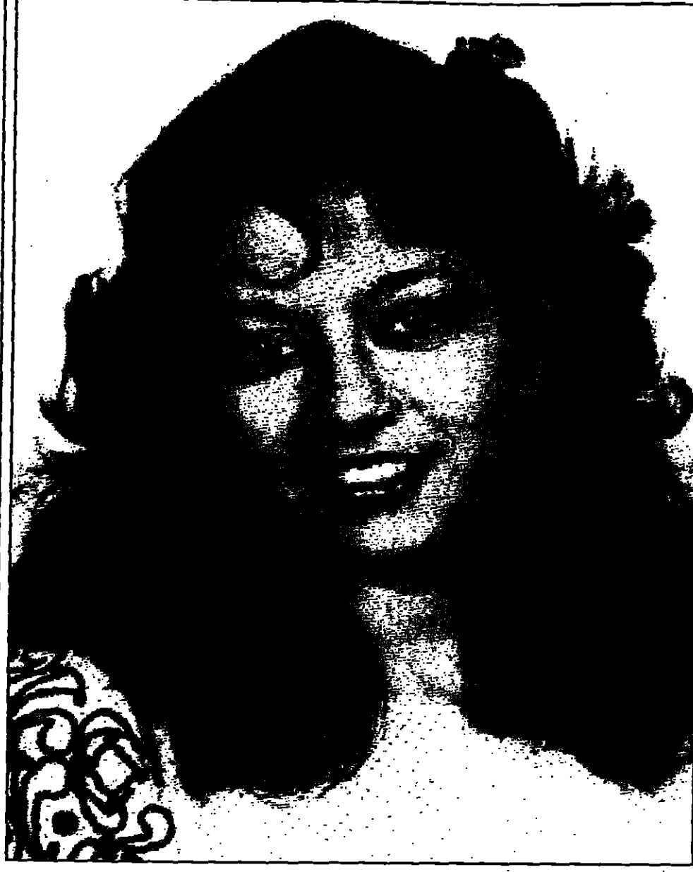
نور الشريف يعود للمسرح وسميرة سعيد متزلدة

في صناعة التبغ التي تحتكرها الدولة بالصين... في واحدة من بين 300 مليون مدخن بالصين حولوا... منتهكة للربح التي تكبر مصدر للدخل في البلاد منذ عشر سنوات.